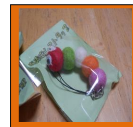
・ストラップ 手芸フェルトをコロコロ丸めて作りました