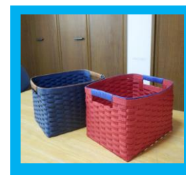
・クラフトバック・小物入れ