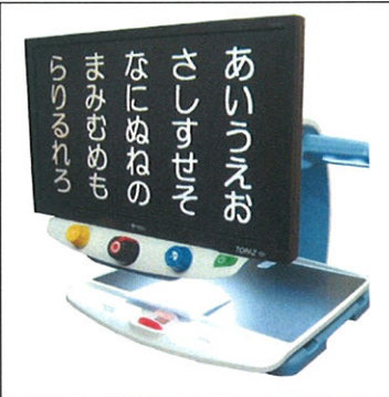
↑多機能型拡大読書器 ※日常生活用具給付等事業候補品

5月14日(土)豊川市勤労福祉会館、5月15日(日)岡崎市竜美丘会館にて開催されました福祉機器展は、視聴覚障がい者の方の日常がより良くなるための機器展です。