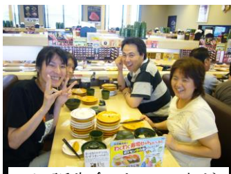
7/8 誕生会。お皿の山ができました(笑)。