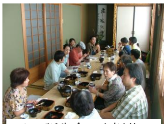
9/14 誕生会。小坂井の「勇寿司」にて。