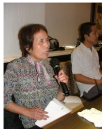
9/17 カラオケ。点字の歌詞カードを使い熱唱！